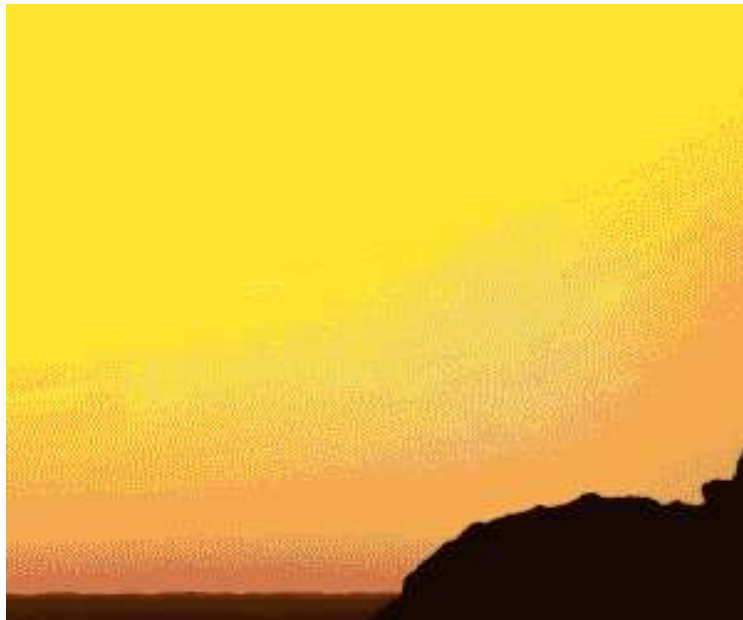
( http://fararu.com/fa/ads/redirect/a/1665 )