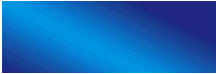
( http://fararu.com/fa/ads/redirect/a/1658 )