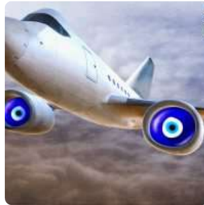
کارتون؛ کاری از شاهرخ حدیدی