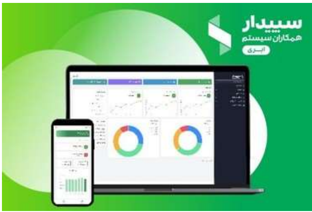
با موبایل گزارش های مالیت رو چک کن (نرم افزار حسابداری ابری)