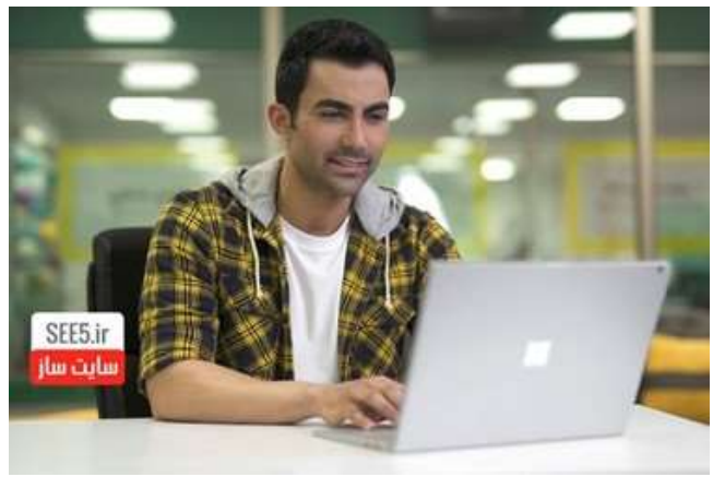
یعنی همیشه تو خواب پول درآورد؟! دیگه وقتشه سایتتو راه اندازی کنی!