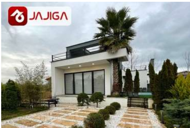
ویلای لوکس و خفن رامسر | اجاره در جاجیگا