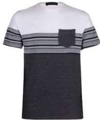
این تخفیف تکرار نمیشن! تا 50% تخفیف لباس مردانه! ادورا