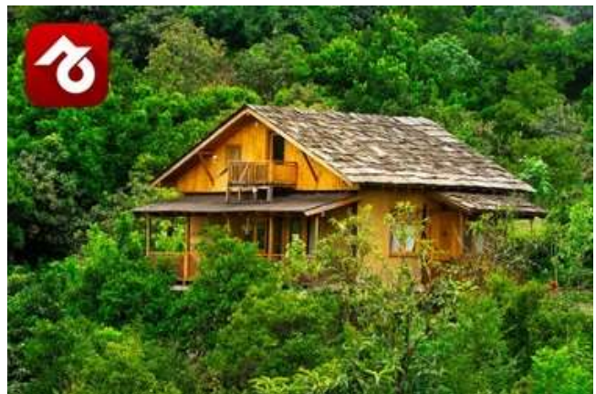
یه کلبه وسط بهشت در رامسر | اجاره در جاجیگا