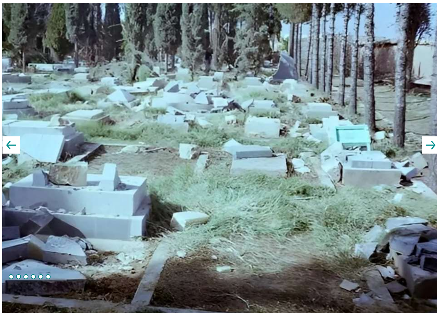
📷 پس از پیروزی انقلاب اسلامی، گورستان‌های بهایبان که به «گلستان جاوید» معروف بود، در شهرها و روستاهای مختلف کشور مورد حمله قرار گرفت و